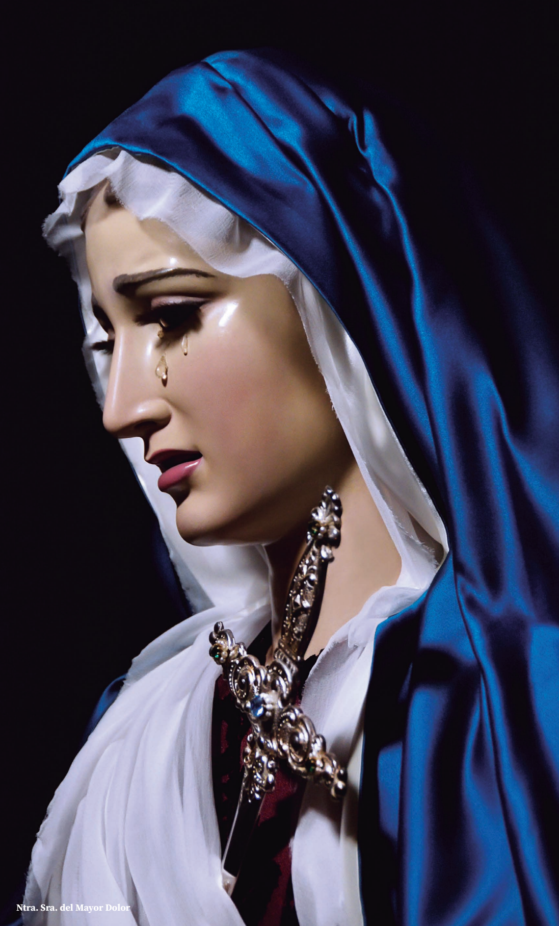
Ntra. Sra. del Mayor Dolor