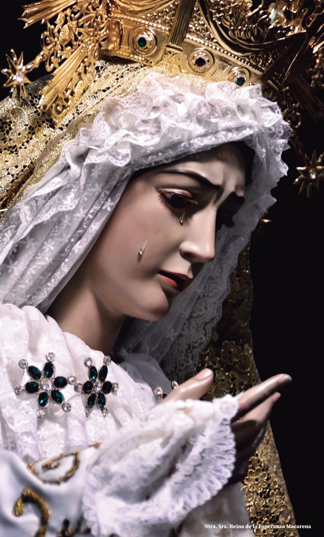
Ntra. Sra. Reina de la Esperanza Macarena