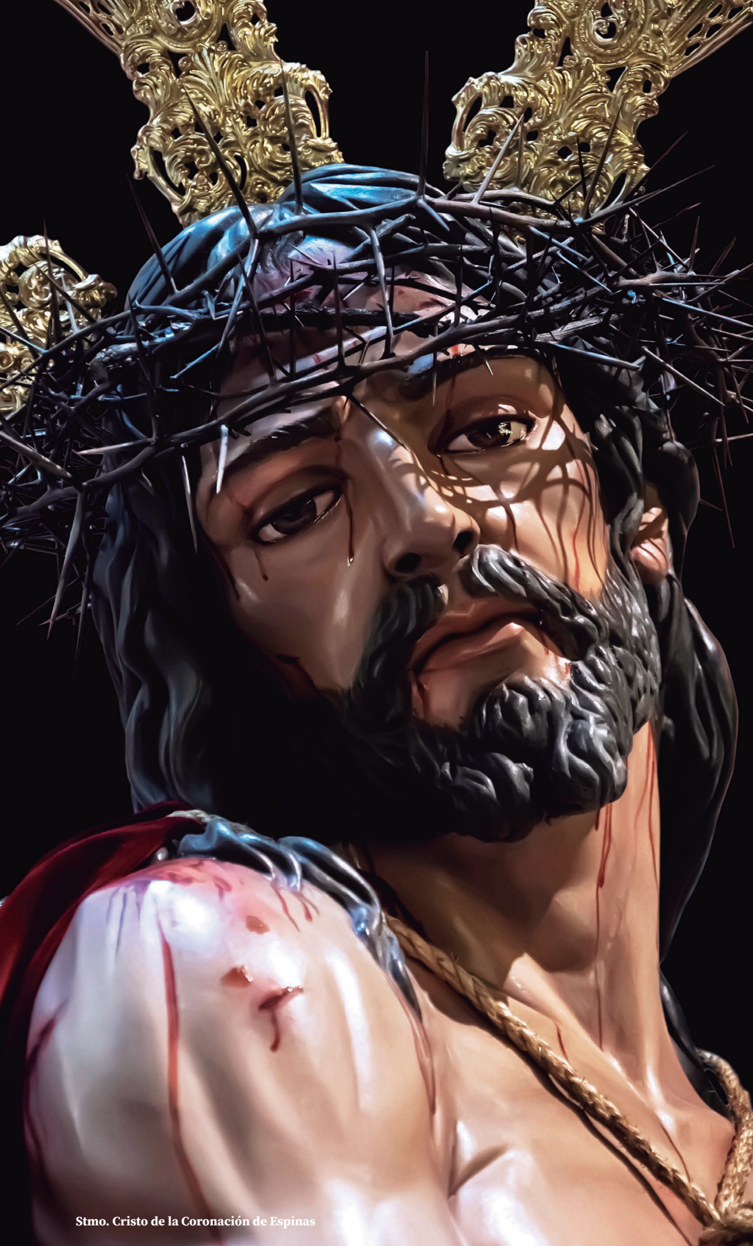
Stmo. Cristo de la Coronación de Espinas