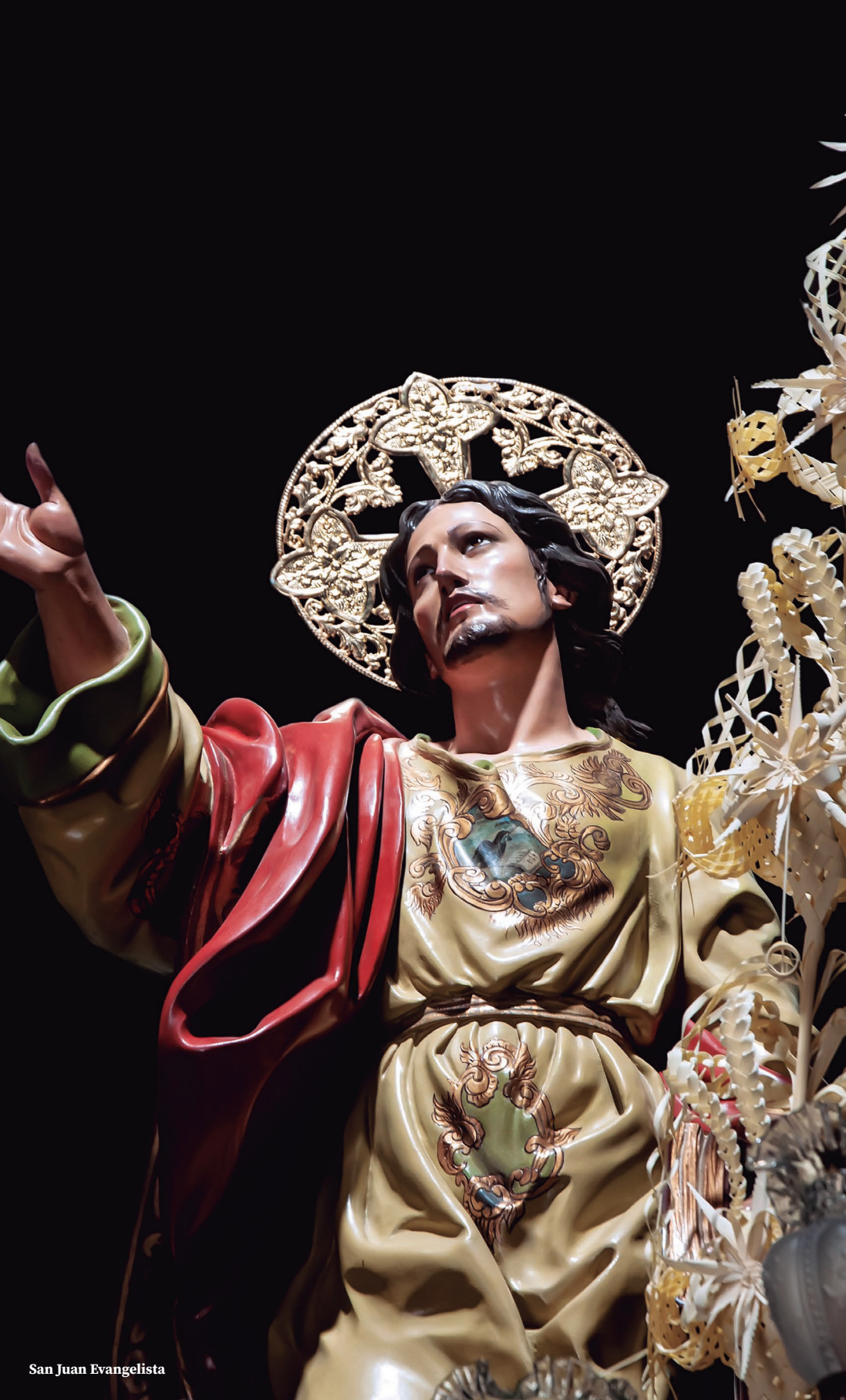
San Juan Evangelista