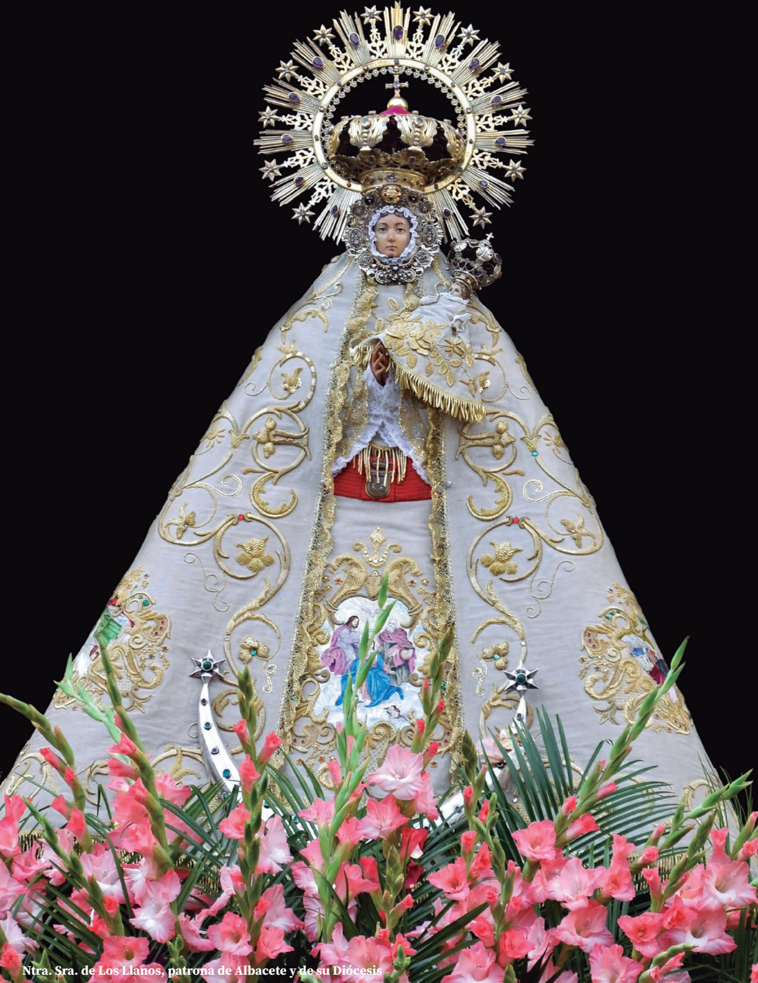
Ntra. Sra. de Los Llanos, patrona de Albacete y de su Diócesis