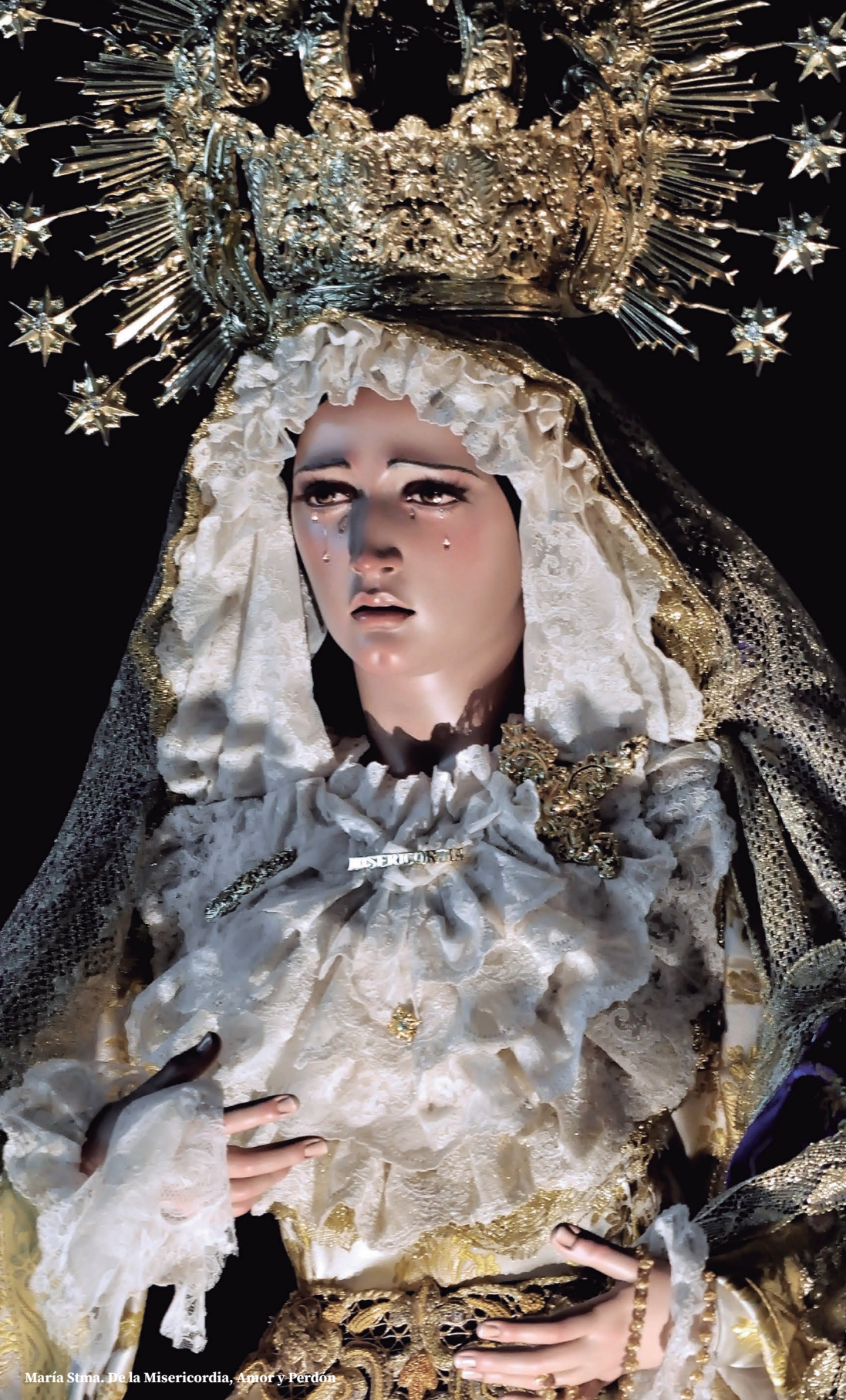
María Stna. De la Misericordia, Amor y Perdón