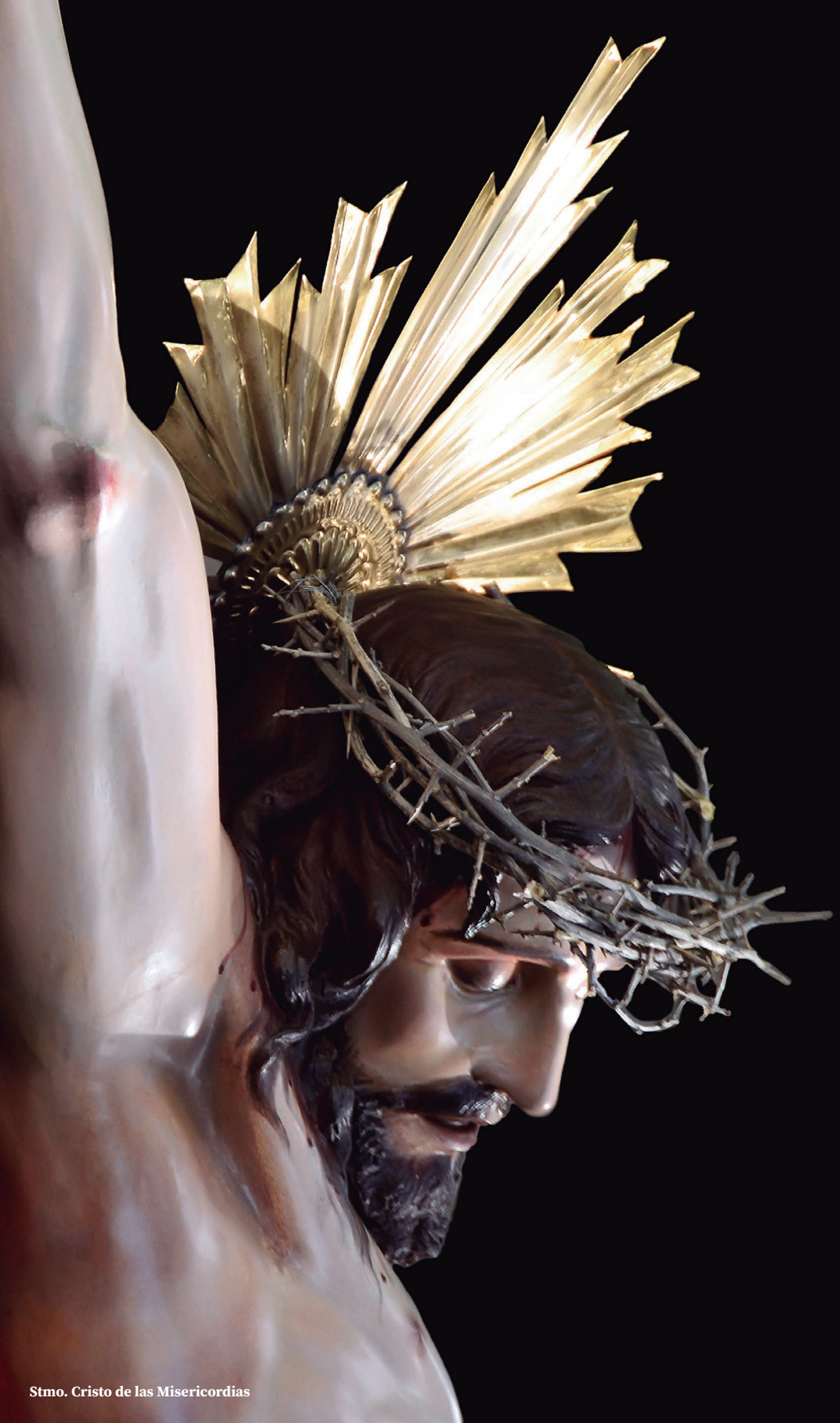
Stmo. Cristo de las Misericordias