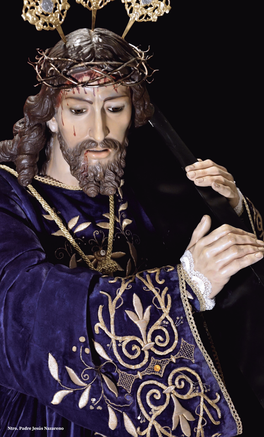
Ntro. Padre Jesús Nazareno