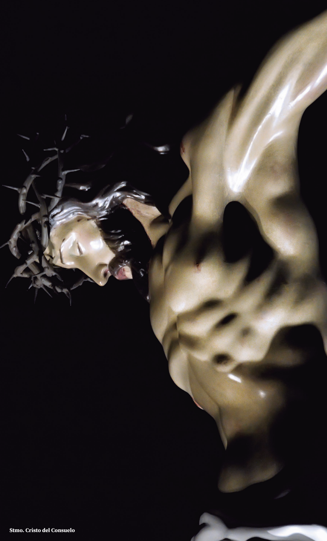
Stmo. Cristo del Consuelo