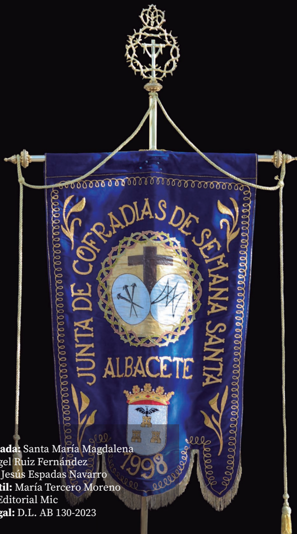
Imagen Portada: Santa María Magdalena