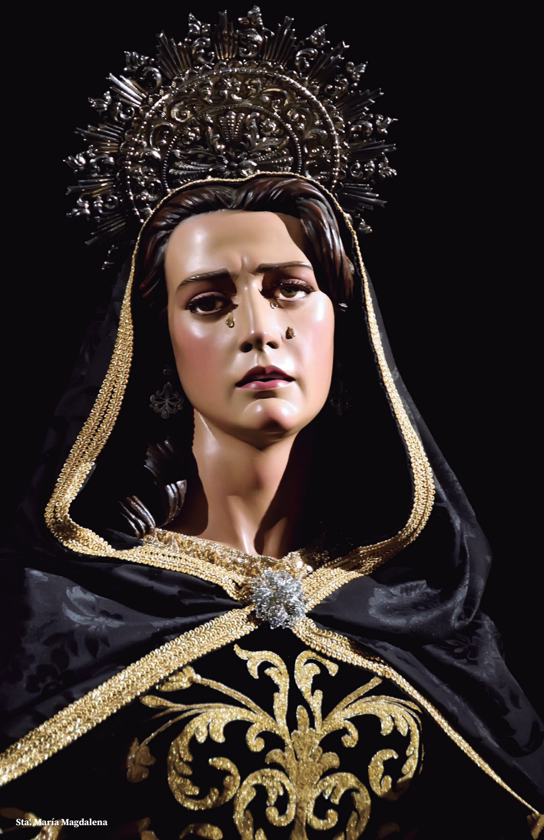
Sta. María Magdalena