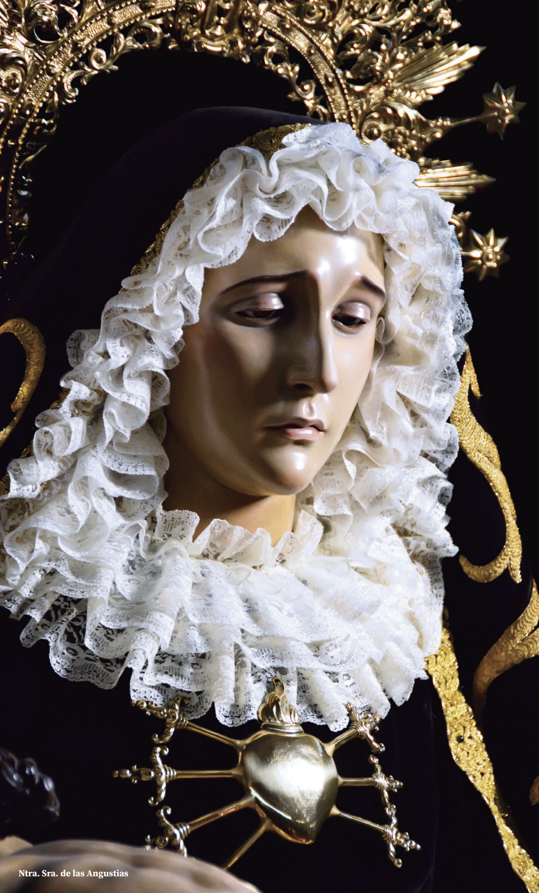
Ntra. Sra. de las Angustias